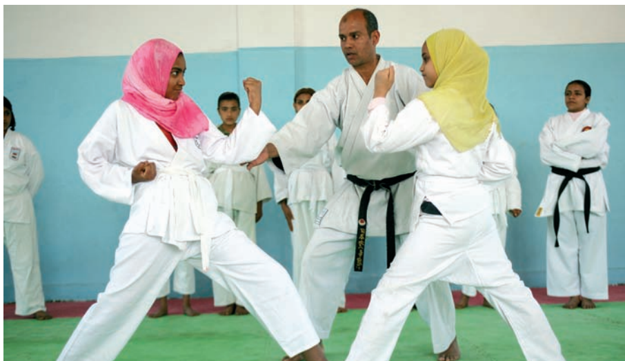
Dos niñas reciben su clase de kárate en un centro de deportes de Alejandría (Egipto).

adaptados a las nuevas realidades emergentes. La escuela y la familia, entre otros agentes sociales, ocupan un lugar privilegiado en la transmisión de estos otros valores, en el fomento de un proyecto de sociedad más justo e inclusivo, que contemple variables como la diversidad cultural, la equidad de género, la cohesión social o la sostenibilidad medioambiental. En este sentido, el deporte y la actividad física poseen una enorme incidencia social y global