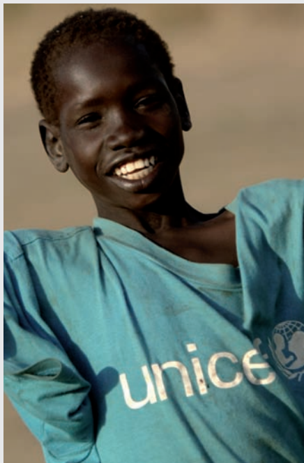
Niño de la ciudad de Nyal (Sudán).

Puede ayudar a escapar de los malentendidos causados por otros gestos.