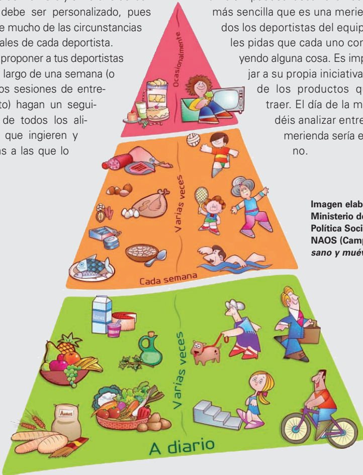
Imagen elaborada por el Ministerio de Sanidad y Política Social, Estrategia NAOS (Campaña ¡Come sano y muévete!).

También puedes desarrollar otra actividad más sencilla que es una merienda con todos los deportistas del equipo en la que les pidas que cada uno contribuya trayendo alguna cosa. Es importante dejar a su propia iniciativa la elección de los productos que han de traer. El día de la merienda podéis analizar entre todos si la merienda sería equilibrada o no.