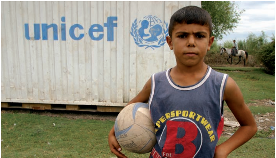
Un niño de Azerbaijan posa en un campamento de desplazados de UNICEF.

deros, de manera que los niños y niñas se reconozcan sujetos activos individual y colectivamente, capaces de transformar la realidad que les rodea. No basta aquí con el análisis del problema y el conocimiento de las técnicas para abordarlo, hay que llegar a la conciencia moral, objetivo mucho más complicado pero ineludible.