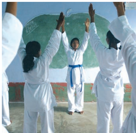
Clase de kárate para chicas en India.

La Agencia Estatal Antidopaje dispone de material divulgativo para trabajar estos contenidos. Un ejemplo de ello es el libro para niños Siempre me elegían el último , disponible en la página web www.aea.gob.es .