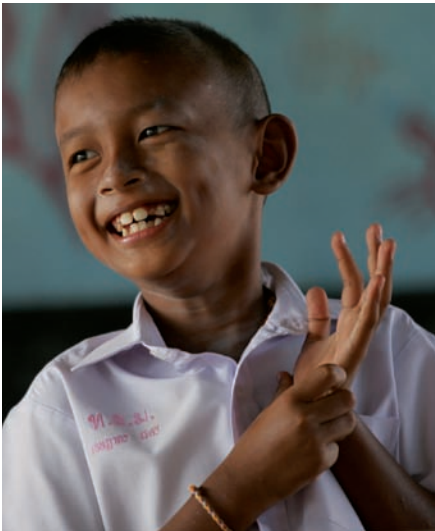
Un niño de Tailandia posa sonriente en una de las nuevas escuelas que UNICEF construyó tras el Tsunami que asoló este país.