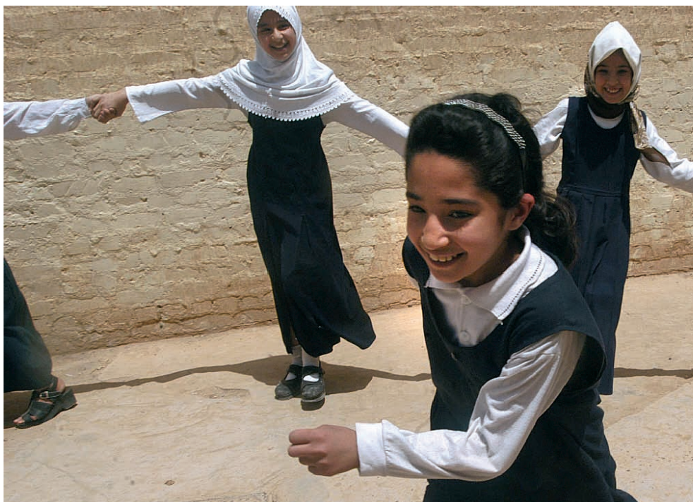
Un grupo de niñas juega en una escuela de uno de los barrios más pobres de Bagdad (Iraq).

la creación de hábitos de vida saludable. Es esencial para el desarrollo físico, intelectual, psicológico y social de las niñas, niños y adolescentes. Por ello, la educación física y la actividad deportiva debe estar integrada en toda educación básica de calidad.