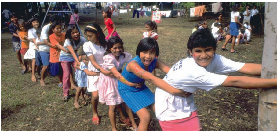
Niños y niñas nicaragüenses afectados por el Huracán Mitch juegan en un centro de UNICEF.

Para ello, esta publicación cuenta con dos partes diferenciadas. La primera, consiste en una breve aproximación al vínculo entre el deporte y los valores. Nos detendremos en definir cuáles son los mismos y cómo transmitirlos, para a continuación analizar el papel que juegan los diferentes agentes sociales responsables de la transmisión de dichos valores, prestando especial atención a la figura del educador o educadora en cuestión. La segunda parte, se dedicará a la presentación de distintas situaciones prácticas a partir de las cuales se podrán trabajar los contenidos tratados anteriormente.