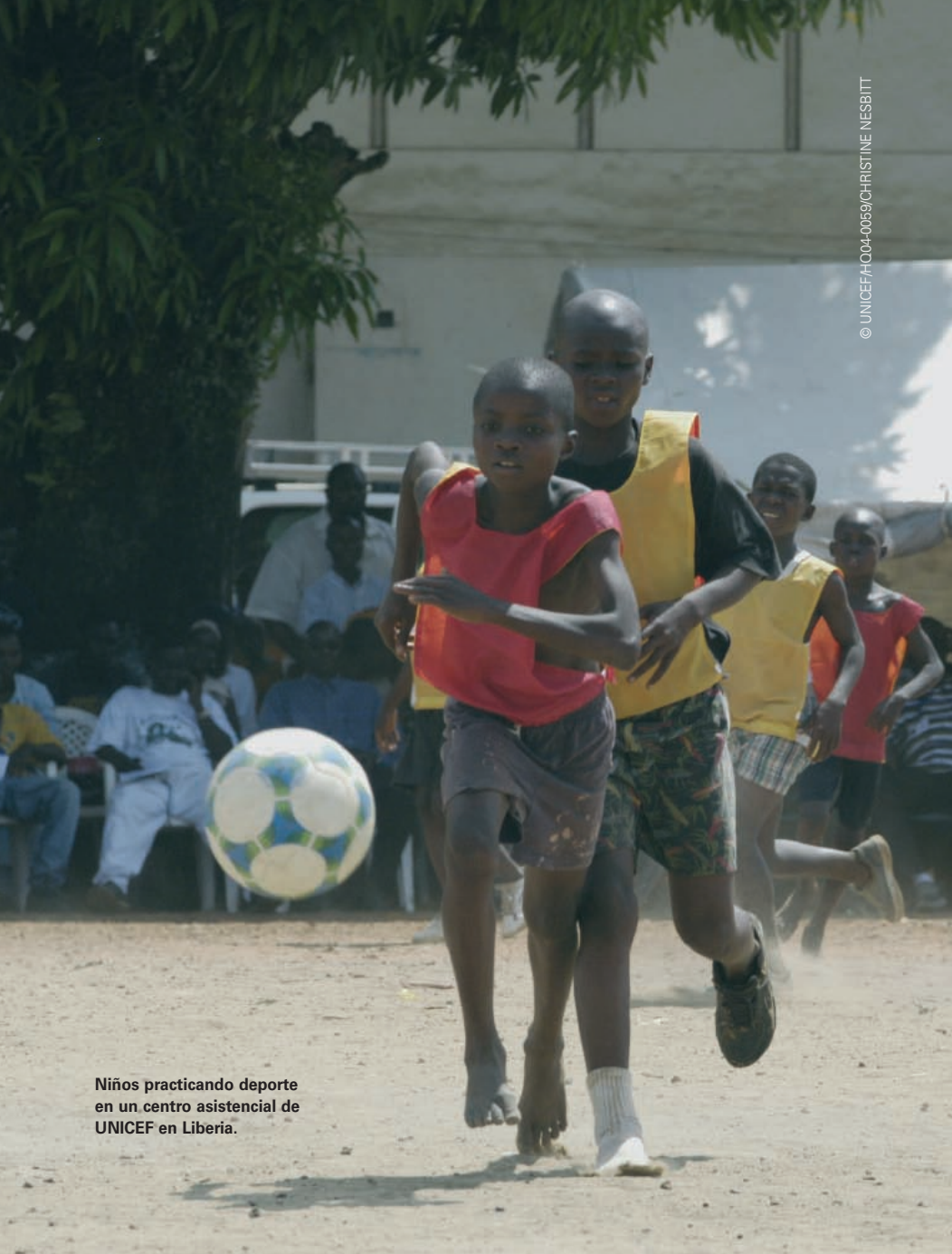
Niños practicando deporte en un centro asistencial de UNICEF en Liberia.