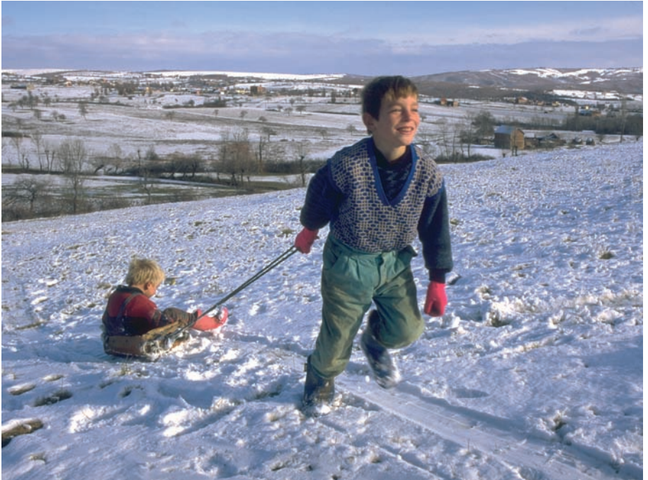
Dos niños juegan con un trineo en la zona norte de Kosovo.

El racismo es inaceptable en todas las ocasiones. Hay que rechazar de pleno la violencia verbal y física y recordemos que los niños y niñas aprenden del ejemplo de las personas adultas. Los actores principales de la competición son los deportistas y equipo técnico, los y las jueces y el público, y todos tienen la obligación de someterse a las leyes no escritas de la deportividad y el juego limpio, que incluyen el respeto y la aceptación de la derrota.