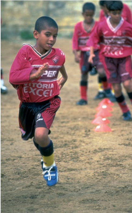
Escuela de fútbol de Salvador de Bahía (Brasil).