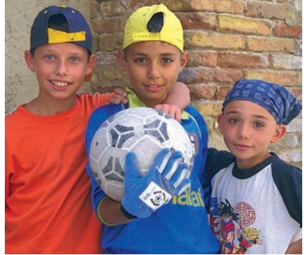
Tres niños de Sicilia, tras un partido de fútbol.

Haz que tus deportistas se pongan en el lugar de todos aquellos niños y niñas que han perdido sus