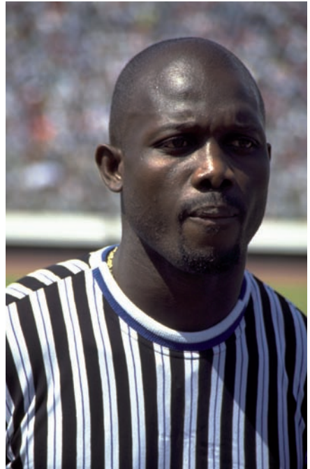
George Weah, Embajador de UNICEF.

Haz que los deportistas de tu equipo escriban una carta al equipo rival informándoles de las actividades que ellos van a promover en la competición y pedirles que se sumen a la iniciativa.